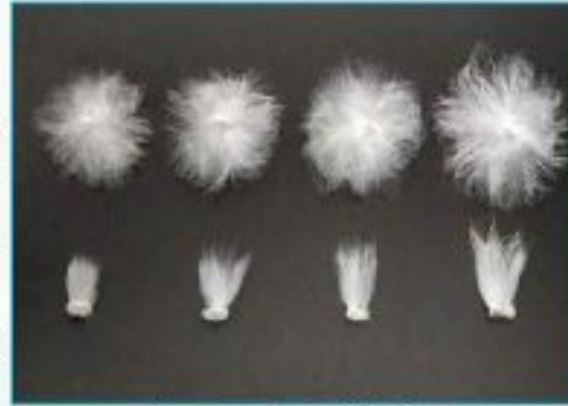
আঁশ তুলার দৈর্ঘ্য নির্ণয়

আঁশের সমস্ত গুণাবলীর মধ্যে আঁশের দৈর্ঘ্যই সবচেয়ে বেশি গুরুত্বপূর্ণ। কেননা যে আঁশ যত লম্বা তা থেকে তত শক্ত সুতা তৈরী করা যায়। পরীক্ষা করে দেখা গেছে যে, আঁশের অন্যান্য গুণগত বৈশিষ্ট্য অপরিবর্তীত থাকলে এবং একই যন্ত্রপাতির সাহায্যে অপরিবর্তীত পরিস্থিতিতে যদি সুতা করা যায়,