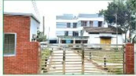
কিনাইদহ কটন ইউনিট অফিস কাম গোডাউন

৬তলা ভিত্তি বিশিষ্ট ৩তলা ভবনের গ্রাউন্ড ফ্লোর এরিয়া-২৭৫৪ বর্গফুট, ২য় তলা-২৩২৩ বর্গফুট, ৩য় তলা-২৩২৩ বর্গফুট, চিলেকোঠা-৪১১ বর্গফুট, সর্বমোট-৭৮১১ বর্গফুট ভবন নির্মাণ কাজ সম্পন্ন হয়েছে।