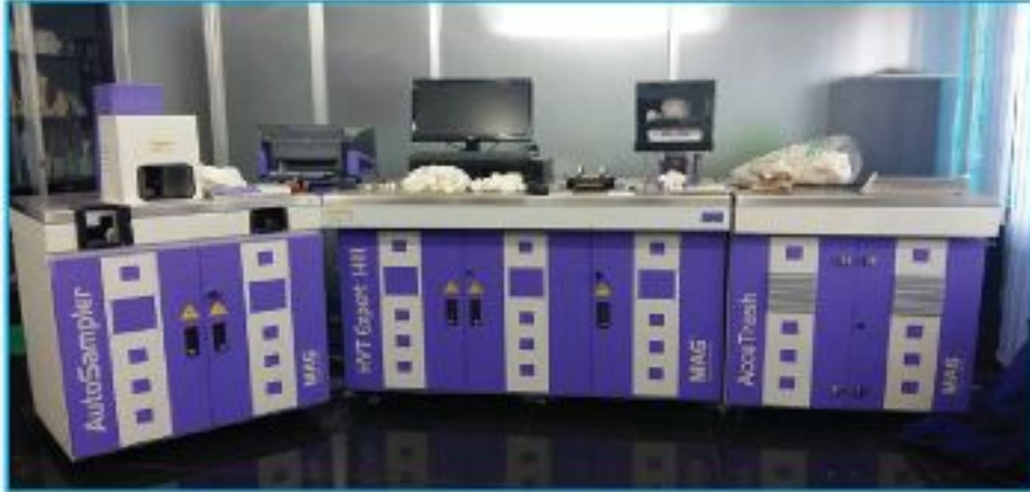
এইচভিআই মেশিনে আঁশ তুলার গুণাগুণ নির্ণয়

আঁশের ইউনিফরমিটি রেশিও যত বেশি হবে, তা থেকে তত ইভেন সুতা তৈরী সম্ভব হবে।