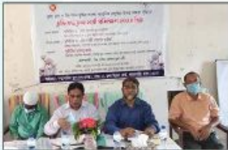
চুক্তিবদ্ধ চাষী প্রশিক্ষণ