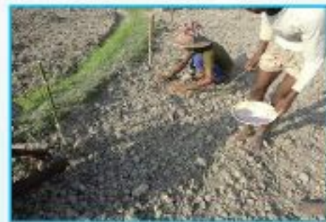
তুলা বীজ বপন