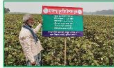
মানসম্পন্ন তুলাবীজ উৎপাদন

মান সম্পন্ন বীজ উৎপাদনের জন্য আরডিপিপিতে ৪৫০ হেক্টরের বিপরীতে ৩৪১ হেক্টর জমিতে মান সম্পন্ন বীজ উৎপাদন হয়েছে এবং ২০১৮-১৯ মৌসুমে ৫০ হেক্টর জমিতে মান সম্পন্ন বীজ উৎপাদন কার্যক্রম চলমান রয়েছে। ২০১৪-১৫ সালে ১৬৫ হেক্টর, ২০১৫-১৬ সালে ৭৬ হেক্টর, ২০১৬-১৭ সালে ৫০ হেক্টর, ২০১৭-১৮ সালে ৫০ হেক্টর, ২০১৮-১৯ মৌসুমে ৫০, ২০১৯-২০ মৌসুমে ৩০ হেক্টর এবং ২০২০-২১ মৌসুমে বাকি ২৯ হেক্টর জমিতে হেক্টর জমিতে মান সম্পন্ন বীজ উৎপাদন কার্যক্রম সম্পাদিত হয়েছে।