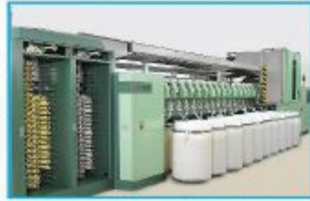
রোটর মেশিনে নিম্ন কাউন্টের সূতা উৎপাদন

এ-গ্রেডের গুণাবলীঃ গ্রেডের নাম গুডমিডলিং, আবর্জনার পরিমাণ ১.০% পর্যন্ত। তুলার রং উজ্জ্বল সাদা, আঁশের দৈর্ঘ্য ৩০ মিলিমিটারের অধিক, আঁশের শক্তি ৩০.০০ গ্রা/টেক্স এর অধিক। আঁশের পরিপক্বতার পরিমাণ ৮৫% এর উপরে। আঁশের সুক্ষতা ৫.০ মাইক্রোনিয়ার এর নিচে। আঁশের ইউনিফরমিটি রেশিও ৮৫ এর উপরে, জিনিং আউট ট্রার্ণ ৩৬% হতে ৪১% এর উপর।