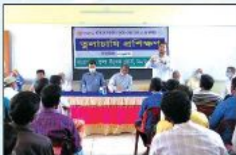
সাধারণ তুলাচাষী প্রশিক্ষণ