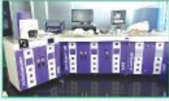
এইচ ডি আই মেশিন