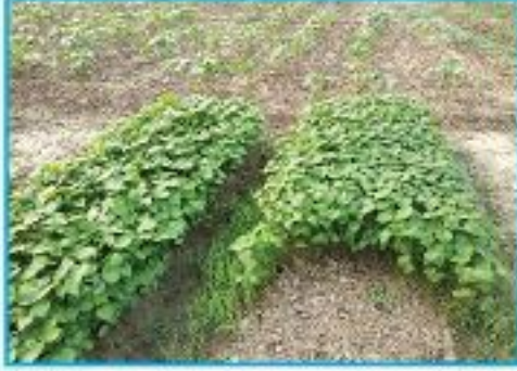
বেড হতে তুলার চারা উন্মোলন

উপরে ছাউনির ব্যবস্থা করে আম পাতার ব্যাগে অথবা কাগজ বা পলিথিন প্যাকেটে চারা তৈরী করে ১০-১৫ দিন বয়সের চারা মূল জমিতে বপন করা যায়। এ ভাবে নাবীতে পাট ও আউশ ধান কেটে ঐ জমিতে তুলা বপন করে অধিক ফলন পাওয়া যায়।