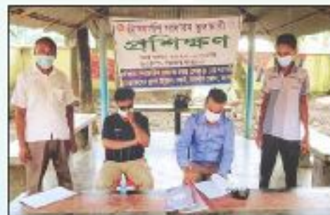
সাধারণ তুলাচাষী প্রশিক্ষণ