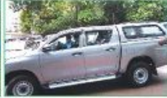
ডাবল কেবিন (পিকআপ)

ক্যামেরা এন্ড এক্সেসরিজ : ২০১৫-১৬ অর্থ বছরে ১২টি ক্রয় এবং ২০১৬-১৭ অর্থ বছরে ৫টি ক্রয় ও সংগ্রহ করা হয়েছে।