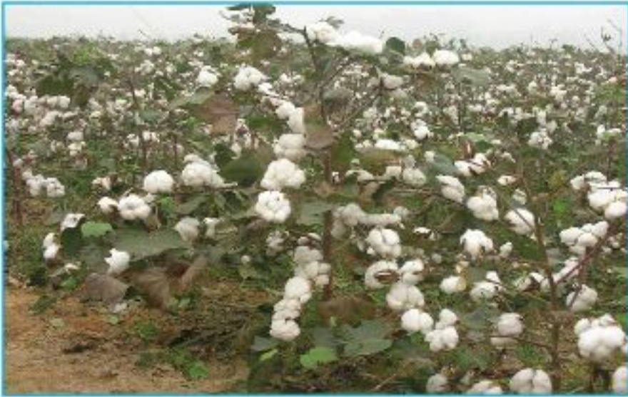
ফুটন্ত তুলার ক্ষেত

বর্তমানে বস্ত্র এবং গার্মেন্টস খাত বাংলাদেশের প্রধান রপ্তানি ও বৈদেশিক মুদ্রা অর্জনকারী খাত। অর্থনৈতিক মূল্য সংযোজনের ক্ষেত্রে বস্ত্র শিল্পের অবদান শিল্পখাতের প্রায় ৪০ শতাংশ এবং জাতীয় আয়ের ১৩ শতাংশ। বাংলাদেশে বস্ত্র খাতের ৪৫০ টি সুতাকলের জন্য বছরে প্রায় ৭৫-৮০ লক্ষ বেল আঁশ তুলার প্রয়োজন হয়, যার সিংহভাগ বিদেশ থেকে আমদানী করে মেটানো হচ্ছে এবং এই চাহিদা উত্তরোত্তর বৃদ্ধি পাচ্ছে। এ পরিমাণ তুলা আমদানী করতে প্রতিবছর প্রায় ২০-২৫ হাজার কোটি টাকা ব্যয় করতে হয়। তা ছাড়া আমাদের বৈদেশিক আয়ের ৮৪ ভাগই আসে তৈরী পোশাক খাত থেকে। প্রায় ৪৫০০ গার্মেন্টস ও তৈরী পোশাকের অন্যান্য খাতে প্রায় ৫০ লক্ষ লোক সরাসরি জড়িত যার বেশির ভাগই মহিলা।