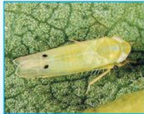
পূর্ণাঙ্গ জ্যাসিড পোকা