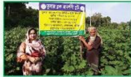
তুলার ব্লক প্রদর্শনী

তুলার ব্লক প্রদর্শনী স্থাপনের জন্য আরডিপিপিতে ১০৪০ হেক্টরের বিপরীতে জুন ২০২১ পর্যন্ত ১০৪০ হেক্টর জমিতে বীজ ব্লক স্থাপন করা হয়েছে। আরডিপিপির লক্ষ্যমাত্রা অনুযায়ী ২০১৪-১৫ সালে ২৫০ হেক্টর, ২০১৫-১৬ সালে ২৫০ হেক্টর, ২০১৬-১৭ সালে ৩০০ হেক্টর, ২০১৭-১৮ সালে ২০০ হেক্টর, ২০১৮-১৯ মৌসুমে ২০ হেক্টর, ২০১৯-২০ মৌসুমে ১০ হেক্টর এবং ২০২০-২১ মৌসুমে বাকি ১০ হেক্টর জমিতে বীজ ব্লক কার্যক্রম সম্পন্ন হয়েছে।