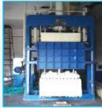
আঁশ তুলার বেলিং

১০। জিনিং এর পূর্বে বীজতুলা অতিরিক্ত শুকানো হলে জিনিং করার সময় আঁশ কেটে যায়। ফলে আঁশ খাটো হয়, আঁশের শক্তি ও সমরূপতার হার কমে যায়। অপরপক্ষে বীজ তুলা কম শুকালে আঁশের রং নষ্ট হয়ে যায় ও আঁশ নিম্ন গ্রেডের হয়। তাই মাঝামাঝি ভাবে তুলা শুকাতে হবে। বীজের গায়ে দাঁত দিয়ে চাপ দিলে ফাটার শব্দ হলেই বুঝতে হবে বীজতুলা শুকানো হয়েছে।