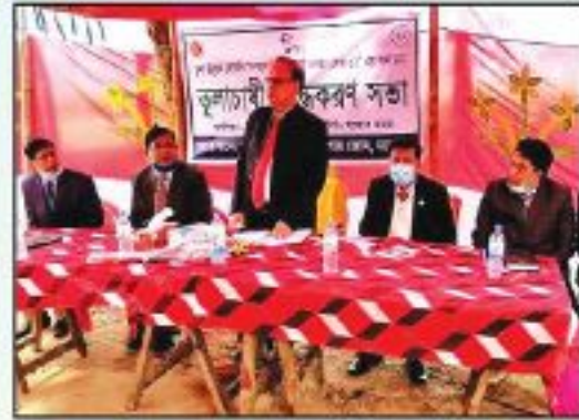
প্রশিক্ষণ কার্যক্রমে অংশগ্রহণ করেন তুলা উন্নয়ন বোর্ডের নির্বাহী পরিচালক ।