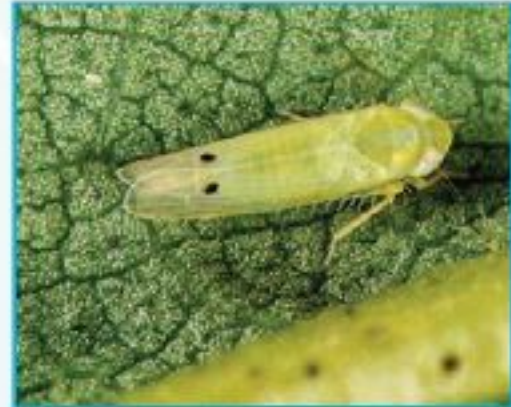
তুলার ক্ষতিকর পোকা আমেরিকান বোলওয়ার্ম ও জ্যাসিড

সিবি-১২ জাতের জিওটি ৪০%। বীজ ১৫ আষাঢ় থেকে ৩০ শ্রাবন পর্যন্ত ( ১ জুলাই থেকে ১৫ আগষ্ট পর্যন্ত ) ১০০ সেমিঃ X ৬০ সেমিঃ দূরত্বে সারিতে বপন