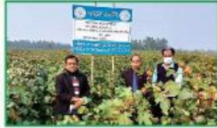
সাধারণ প্রদর্শনী প্রট

তুলার সাধারণ প্রদর্শনীর জন্য আরডিপিপিতে ১০৫৯০ টি বিপরীতে জুন ২০২১ পর্যন্ত ১০৫৯০ টি বিঘা প্রদর্শনী বাস্তবায়িত/স্থাপন করা হয়েছে। আরডিপিপির লক্ষ্যমাত্রা অনুযায়ী ২০১৪-১৫ সালে ১২৫০ টি, ২০১৫-১৬ সালে ১৩০০ টি, ২০১৬-১৭ সালে ১৭৫০ টি, ২০১৭-১৮ সালে ৭০০ টি, ২০১৮-১৯ অর্থ বছরে ২৫৯০ টি, ২০১৯-২০ অর্থ বছরে ১৫০০ টি এবং ২০২০-২১ অর্থ বছরে ১৫০০ টি তুলার সাধারণ প্রদর্শনী প্রট করা হয়েছে।