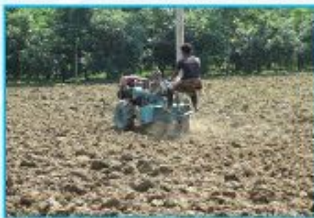
তুলার চাষের জমি তৈরি

তুলা উন্নয়ন বোর্ডের নিজস্ব উফশী ওপি জাতের ক্ষেত্রে বিঘা প্রতি ১.০ কেজি এবং হাইব্রিডের ক্ষেত্রে ৫০০-৬০০ গ্রাম বীজের প্রয়োজন হয়। বীজ বপনের পূর্বে তুলাবীজ ৩-৪ ঘন্টা পানিতে ভিজিয়ে শুকনো মাটি বা ছাই দিয়ে ঘষে নেয়া উত্তম। মনে রাখা দরকার উচ্চ ফলনের জন্য বিঘা প্রতি কমপক্ষে ৩৩০০ গাছ থাকা আবশ্যিক।