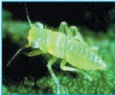
জ্যাসিড পোকাকার লিম্বা/বাচ্চা

বোলওয়ার্ম, ঘোড়া পোকা, আর্চা পোকা ইত্যাদি চর্বনকারী পোকাকার জন্য স্পর্শ বিষ যেমন- রিপকর্ড, ভলিউমফ্লেক্সি, এমাটিন, জেনিথ, ফেন্টক্স, জেনেথ্রিন-১০ইসি, ওয়াভার-৫ইসি, ইত্যাদি ব্যবহার করতে হবে।