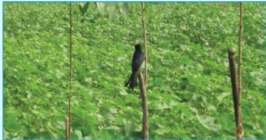
সমন্বিত বলাই ব্যবস্থাপনা