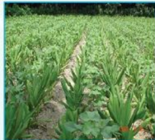
তুলার সাথী ফসল