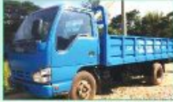
৩টি মিনিট্রাক (৩টন)