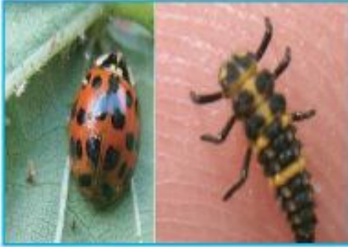
শেডিবার্ড বিটল পূর্ণাঙ্গ ও বাচ্চা