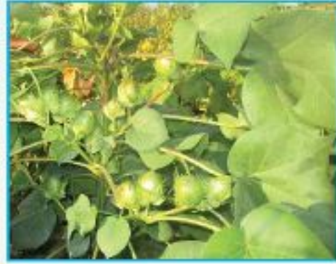
উচ্চফলনশীল জাতের সমভূমির তুলা চাষ

বীজ ১৫ আষাঢ় থেকে ৩০ শ্রাবন পর্যন্ত ( ১ জুলাই থেকে ১৫ আগষ্ট পর্যন্ত) ৯০ সেমিঃ x ৪৫ সেমিঃ দূরত্বে সারিতে বপন করতে হবে। উপযুক্ত সার সঠিক পরিমাণ ও নিয়মমাফিক ব্যবহার করতে হবে। তুলা গাছের অতিরিক্ত বৃদ্ধি নিয়ন্ত্রনের জন্য প্রতিবার সার প্রয়োগের সময় অবশ্যই পটাশ সার ইউরিয়া সারের তুলনায় বেশী পরিমাণে মিশ্রিত করে একত্রে প্রয়োগ করতে হবে। সমন্বিত বালাই ব্যবস্থাপনা অর্থাৎ পোকা-মাকড় দমনের একের অধিক পদ্ধতির সমন্বিত প্রয়োগের মাধ্যমে ক্ষতিকারক পোকা-মাকড়ের আক্রমণকে প্রতিহত করতে হবে। ফুটন্ত সাদা ধবধবে বীজতুলা যা সহজে হাতের আঙ্গুল দিয়ে টেনে তোলা যায় এমন তুলা সংগ্রহ করতে হবে। মাঠ থেকে সংগ্রহের পর আঁশ ও বীজের মান উন্নয়নের জন্য বীজতুলা ভালো করে রৌদ্রে শুকিয়ে নিতে হবে। ফসল সংগ্রহের সময় ১৫ নভেম্বর থেকে ৩০ জানুয়ারী পর্যন্ত। সিবি-১৬ জাতের ফলন ৪-৪.৫ টন/হেক্টর।