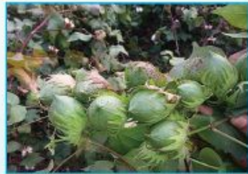
উচ্চ ফলনশীল তুলার বোল