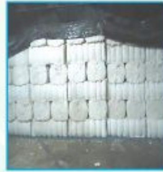
বেলিংকৃত আঁশ তুলা