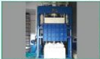
বেলিং মেশিন (সিস্টেম চেম্বার)

মেশিনারি ও অন্যান্য যন্ত্রপাতি : ২০১৫-১৬ অর্থ বছরে ১টি এইচডিআই এবং ২০১৬-১৭ অর্থ বছরে ১০টি জিনিং মেশিন, ৭টি বেলিং মেশিন (সিস্টেম চেম্বার), ২০ টি প্যান ব্যালেন্স, ১টি এফিস কটন টেষ্টার, ৪টি এয়ার ব্লাস্ট স্প্রেয়ার সংগ্রহ করা হয়েছে।