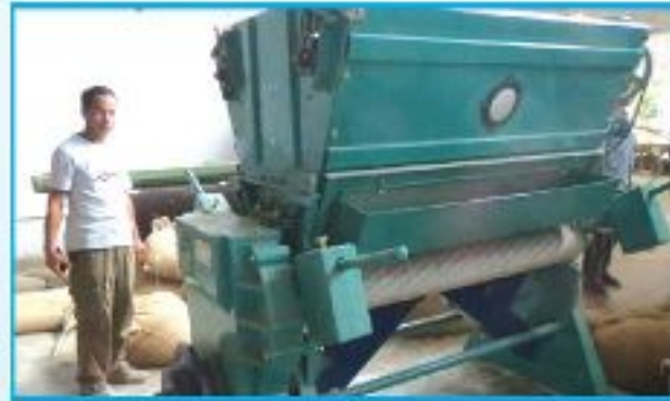
বীজ তুলা জিনিং