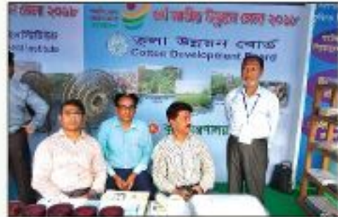
কৃষি প্রযুক্তি মেলা