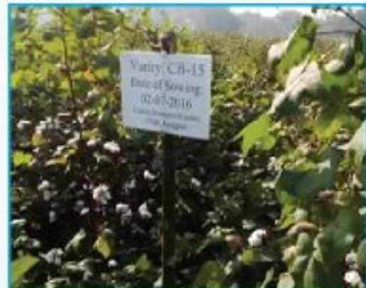
তুলার বিভিন্ন জাত