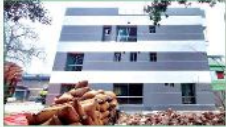
মেহেরপুর কটন ইউনিট অফিস কাম গোডাউন

৬তলা ভিত্তি বিশিষ্ট ৩তলা ভবনের গ্রাউন্ড ফ্লোর এরিয়া-২৭৫৪ বর্গফুট, ২য় তলা-২৩২৩ বর্গফুট, ৩য় তলা-২৩২৩ বর্গফুট, চিলেকোঠা-৪১১ বর্গফুট, সর্বমোট-৭৮১১ বর্গফুট ভবন নির্মাণ কাজ সম্পন্ন হয়েছে।