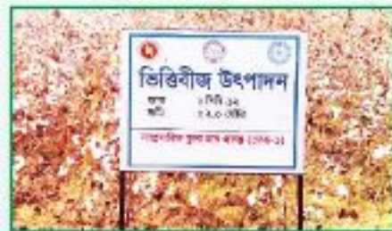
তুলার ভিত্তিবীজ উৎপাদন

তুলার ভিত্তি বীজ উৎপাদনের জন্য আরডিপিপিতে ১৩০ হেক্টর জমির বিপরীতে জুন ২০২১ পর্যন্ত ১৩০ হেক্টর জমিতে ভিত্তি বীজ উৎপাদন সম্পন্ন হয়েছে। ২০১৪-১৫ সালে ২ হেক্টর, ২০১৫-১৬ সালে ৩০ হেক্টর এবং ২০১৬-১৭ সালে ৪৬ হেক্টর, ২০১৭-১৮ সালে ৪৬ হেক্টর, ২০১৯-২০ মৌসুমে ৩ হেক্টর এবং ২০২০-২১ মৌসুমে বাকি ৩ হেক্টর জমিতে ভিত্তি বীজ উৎপাদন কার্যক্রম সম্পাদিত হয়েছে।