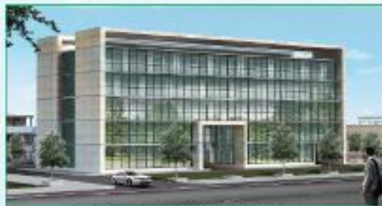
তুলা উন্নয়ন বোর্ডের নির্মাণাধীন "তুলা ভবন"

খতিয়ান, দাগ ও মৌজা : তেজগাঁও থানাধীন তেজতরী মৌজার খতিয়ান নং-১২, দাগ নং-১২৫৪, মোট জমির পরিমাণ : ২.১১৬৮ একর। তুলা উন্নয়ন বোর্ডের ঢাকা জোনাল ও আঞ্চলিক কার্যালয় স্থাপন : ১৯৭৭, ১৯৮১। তুলা উন্নয়ন বোর্ডের আওতাধীন সম্প্রসারিত তুলা চাষ প্রকল্প (ফেজ-১) (২য় সংশোধিত) এর আওতায় কৃষি ল্যাবরেটরী বিল্ডিং এর স্থলে নতুন ভবন নির্মাণের জন্য ২৭/১১/২০১৪ ইং তারিখে অনুষ্ঠিত এডিপি সভায় সিদ্ধান্ত গৃহীত হয়। বেইজমেন্ট ফ্লোর-১৩২৮৬ বর্গফুট, গ্রাউন্ড ফ্লোর এরিয়া-১৩৭৩৪ বর্গফুট, ২য় তলা-১৩৭৩৪ বর্গফুট, ৩য় তলা-১৩৬৬৩ বর্গফুট, ৪র্থ তলা-১৩৬৬৩ বর্গফুট, ৫ম তলা-১৩৬৬৩ বর্গফুট, ৬ষ্ঠ তলা-৬৯৩৫ বর্গফুট, সর্বমোট-৮৮৬৭৮ বর্গফুট ভবন নির্মাণ কাজ প্রক্রিয়াধীন রয়েছে।