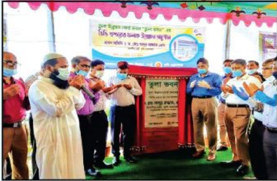
মাননীয় কৃষিমন্ত্রী ড. মোঃ আব্দুর রাজ্জাক এমপি তুলা উন্নয়ন বোর্ড ভবন "তুলা ভবন" এর ভিত্তি প্রস্তর ফলক উন্মোচন করেন