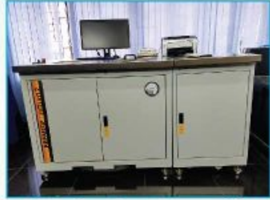
এফিস মেশিনে আঁশ তুলার গুণাগুণ নির্ণয়

আঁশের সূক্ষ্মতা বলতে বুঝায়, ইহার শারিরিক স্থূলতার পরিমাণ। আঁশের সূক্ষ্মতা বা ফাইননেস পরিমাপের একক হলো মাইক্রোনিয়ার ও মিলিটেক্স। মাইক্রোনিয়ার অর্থ হলো মাইক্রোগ্রাম (এক মাইক্রোগ্রাম=0.001 মি:গ্রাম) পার ইঞ্চি। চিকন আঁশ দিয়ে গুণগতমানের ও উচ্চ কাউন্টের সুতা তৈরী করা হয়। এই সুতা থেকে