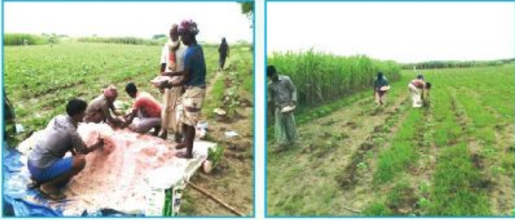
জমিতে সুষম সার প্রয়োগ

তুলা গাছের অতিরিক্ত বৃদ্ধি নিয়ন্ত্রনের জন্য প্রতিবার সার প্রয়োগের সময় অবশ্যই পটাশ সার ইউরিয়া সারের তুলনায় বেশী পরিমাণে মিশ্রিত করে একত্রে প্রয়োগ করতে হবে। সমন্বিত বালাই ব্যবস্থাপনা অর্থাৎ পোকা-মাকড় দমনের একের অধিক পদ্ধতির সমন্বিত প্রয়োগের মাধ্যমে ক্ষতিকারক পোকা-মাকড়ের আক্রমণকে প্রতিহত করতে হবে। ফুটন্তসাদা ধবধবে বীজতুলা যা সহজে হাতের আঙ্গুল দিয়ে টেনে তোলা যায় এমন তুলা সংগ্রহ করতে হবে। মাঠ থেকে সংগ্রহের পর আঁশ ও বীজের মান উন্নয়নের জন্য বীজতুলা ভালো করে রৌদ্রে শুকিয়ে নিতে হবে। ফসল সংগ্রহের সময় ১৫ নভেম্বর থেকে ৩০ জানুয়ারী পর্যন্ত।