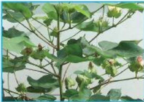
উচ্চ ফলনশীল তুলার ফুল

তুলা গবেষণা ও উন্নয়নের জন্য সরকারী-বেসরকারী সহযোগিতায় বিগত কয়েক বছর যাবৎ বাংলাদেশে হাইব্রিড তুলার চাষ হচ্ছে। উক্ত উদ্যোগের আওতায় বাংলাদেশের বিভিন্ন বীজ কোম্পানী চীন থেকে হাইব্রিড তুলাবীজ আমদানি করেছে এবং তুলা উন্নয়ন বোর্ড উক্ত বীজের উপযোগিতা যাচাইসহ চাষাবাদ প্রযুক্তি উদ্ভাবনের জন্য গবেষণা কার্যক্রম পরিচালনা করেছে। তাছাড়া সিডিবি হাইব্রিড তুলার একটি জাত উদ্ভাবন করেছে। হাইব্রিড তুলা উচ্চ ফলন সক্ষমতার জন্য চাষী পর্যায়ে, অধিক জিনিং আউট টার্ন বা জিওটি এর জন্য জিনার পর্যায়ে এবং উন্নত আঁশের গুণাবলীর কারণে স্পিনারদের নিকট বিপুল জনপ্রিয়তা পেয়েছে। তুলা ফসল উৎপাদনের আধুনিক প্রযুক্তিসমূহ যথাযথভাবে অনুসরণ করে তুলা চাষীরা তুলার কাংশিত ফলন পেতে পারেন এবং আর্থিকভাবে লাভবান হতে পারেন। এ ছাড়া প্রযুক্তিসমূহ অনুসরণ করলে কৃষক ভাইদের যেমন স্বাস্থ্য সুরক্ষা হবে পাশাপাশি পরিবেশ দূষণও কমে আসবে। কৃষকের স্বাস্থ্য, পরিবেশ, স্থানীয় বাজার ও বিশ্ববাজার ইত্যাদি বিষয়কে গুরুত্ব দিয়ে বাংলাদেশ তুলা ফসলের আধুনিক প্রযুক্তিসমূহ বাস্তবায়ন করা হচ্ছে।