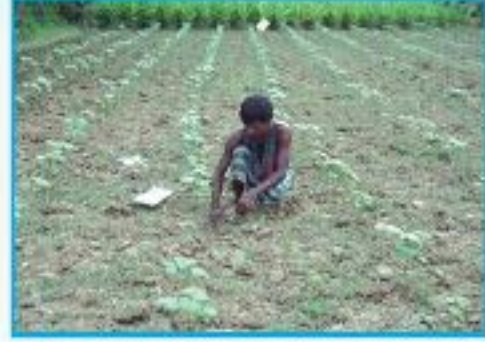
তুলার চারা রোপণ