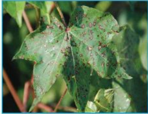
পাতায় দাগ পড়া রোগ

Alternaria , Cercospra প্রধান। এ রোগে গাছের পাতা আক্রান্ত হয়। Alternaria দ্বারা আক্রান্ত পাতায় গোলাকার দাগ দেখা যায় এবং আক্রান্ত অংশ খসে পড়ে। Cercospora দ্বারা আক্রান্ত পাতায় অনিয়মিত বড় বড় দাগের সৃষ্টি করে। মারাত্মক আক্রমণের ক্ষেত্রে গাছের পাতা