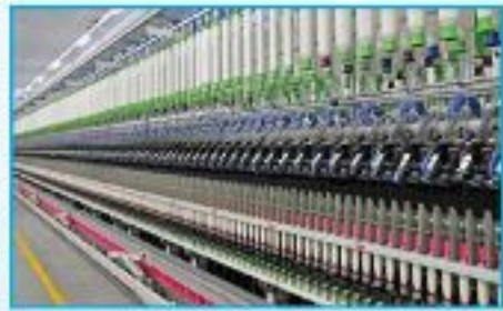
রিং ফ্রেমে উচ্চ কাউন্টের সুতা উৎপাদন