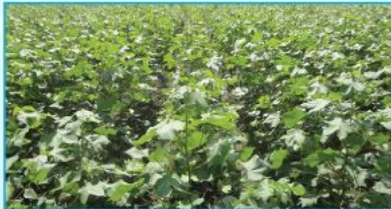
তুলা ফসল উৎপাদনের আধুনিক প্রযুক্তি ও কগাকৌশল