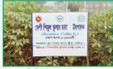
দেশী শিমুল তুলার চারা উৎপাদন

জুন ২০২১ পর্যন্ত মোট ৫,৪৭,২৫০ টি শিমুল চারা উৎপাদন সম্পন্ন হয়েছে। ২০১৮-১৯ মৌসুমে ১১০৭৫০ টি শিমুল চারা উৎপাদনের লক্ষ্য মাত্রা নির্ধারণ করা হয়েছে। ২০১৪-১৫ সালে ২৩৭৮০ টি চারা, ২০১৫-১৬ সালে ২৩০০০ টি চারা এবং ২০১৬-১৭ সালে ১৬১,০০০ টি চারা, ২০১৮-১৯ মৌসুমে ১১০৭৫০ টি চারা, ২০১৯-২০ মৌসুমে ৪৫০০০ টি চারা এবং ২০২০-২১ মৌসুমে বাকি ৪৫০০০ টি চারা শিমুল তুলার চারা উৎপাদন কার্যক্রম সম্পন্ন হয়েছে।